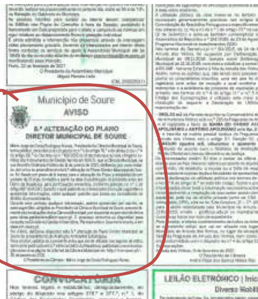
Figura 3 – Aviso Publicado no “ Correio da Manhã ” - Quinta-feira, 25 de fevereiro de 2021